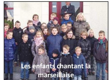
Les enfants chantant la marseillaise