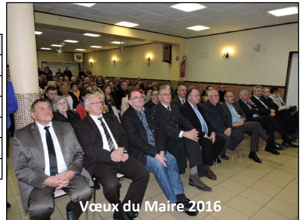
Vœux du Maire 2016