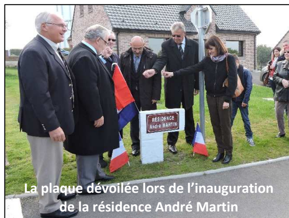
La plaque dévoilée lors de l'inauguration de la résidence André Martin