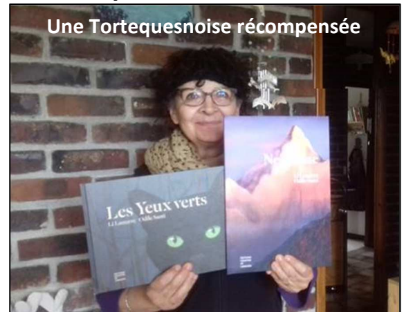
Une Tortequesnoise récompensée