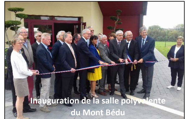
Inauguration de la salle polyvalente du Mont Bédou